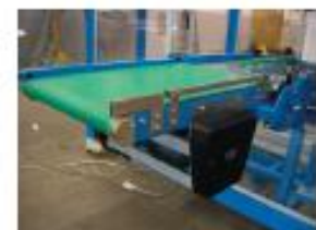
Separering av produkter